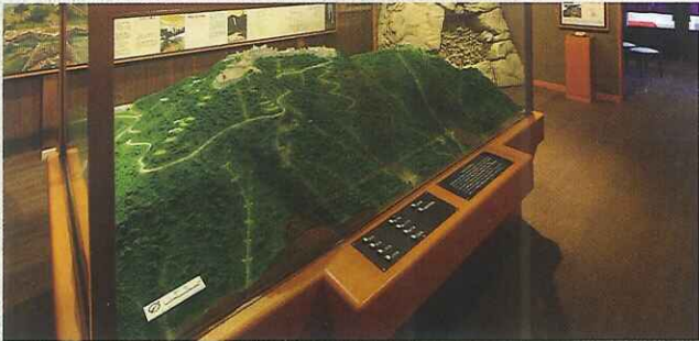
竹田城跡鳥瞰模型 竹田城跡がそびえる古城山(別名:虎臥山)を、300分の1スケールで再現しました。石垣はもちろん、大壘堀や登り石垣、太田垣時代の遺構など細部にわたり表現しています。